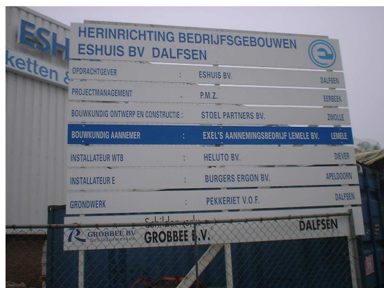
Overzicht van de betrokken partijen