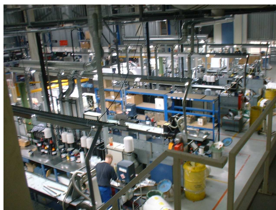
De drukkerij na de verhuizing